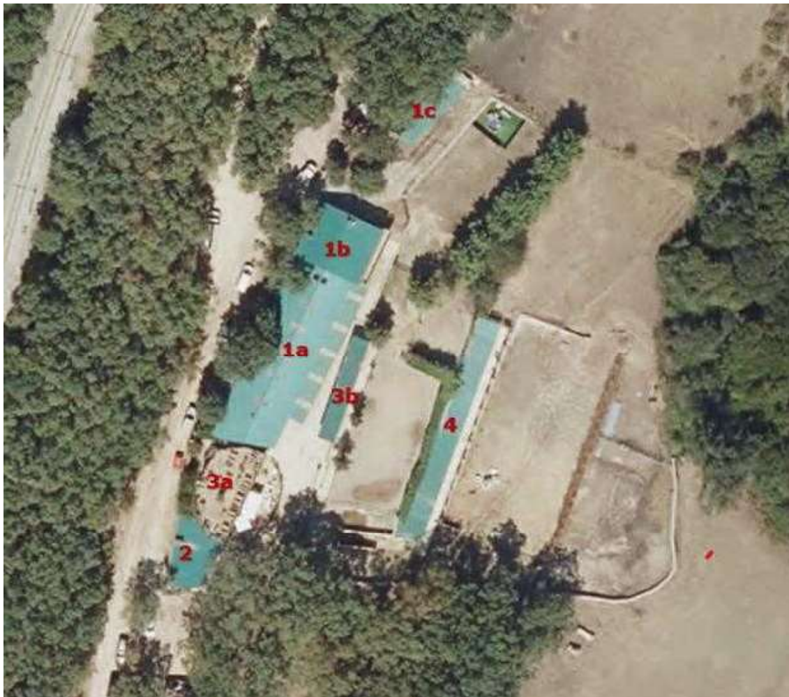
Ubicación de las edificaciones sobre ortofoto.

II.III. Tras la solicitud realizada, las administraciones con competencias afectadas emiten los siguientes informes: